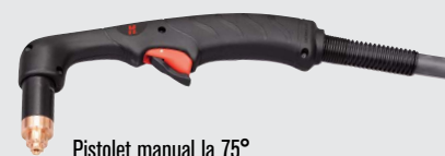
Pistolet manual la 75°

Tipuri standard de pistolete Duramax (pentru mai multe tipuri de pistolete, consultați www.hypertherm.com )