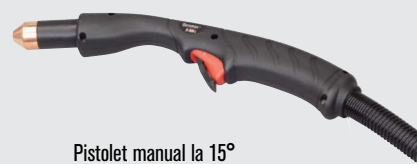
Pistolet manual la 15°